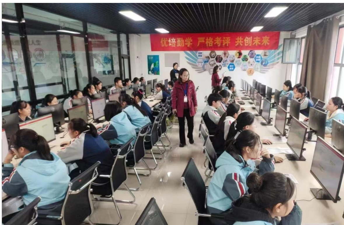
图 9 1+X 幼儿照护职业技能等级证书考试

方案，优化课程体系，使学生在完成学历教育的同时，能够顺利考取相关职业技能等级证书。此外，学校还加强与职业技能等级证书评价组织的沟通与合作，及时了解证书标准与要求，确保培训工作与证书考核无缝对接，提高证书通过率，为学生就业与发展增添有力砝码。2022年4月已被批准为幼儿照护1+X证书试点校，2022年-2024年，学校每年组织开展幼儿照护职业技能等级证书培训和考务工作，通过率均为98%以上。