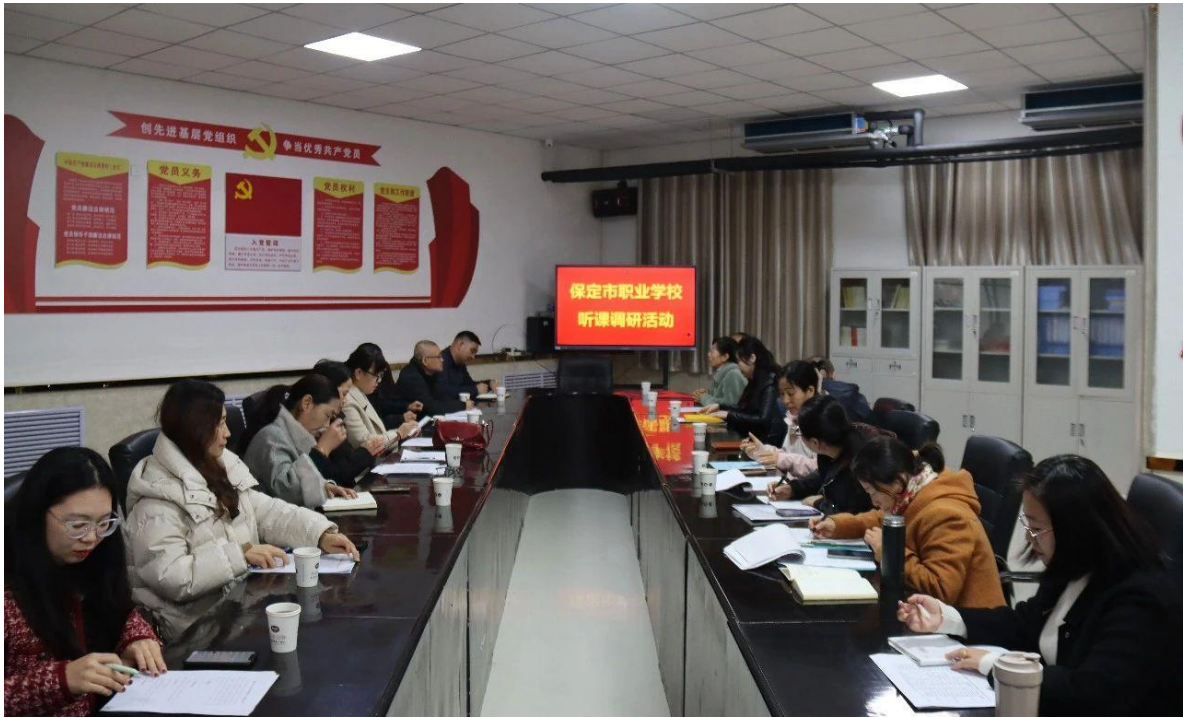
图 12 保定市中职学校听评课调研活动