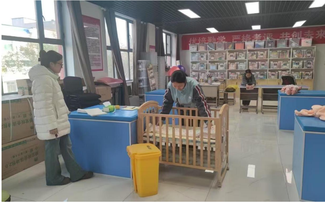
图 18 学生实习实训