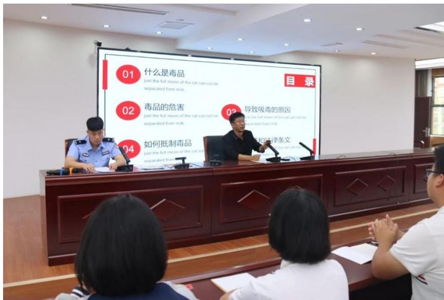
图 5 禁毒教育宣传活动

为深化青少年毒品预防教育工作，进一步筑牢禁毒第一道防线，切实提升在校学生禁毒意识，9月26日，蠡县职教中心邀请蠡县公安局禁毒大队到校开展禁毒教育宣传活动。此次宣传活动从“你知道什么是毒品吗？”“你有没有从电视上见过吸毒的人？”“大家是不是会认为毒品离我们很遥远？”三个问题展开，引发学生思考。警官结合学生好奇心强、心理防线弱的特点，通过PPT展示的形式向学生普及了毒品的种类、滥用毒品的症状和毒品的危害，进一步提升了学生的禁毒意识和自我保护能力。