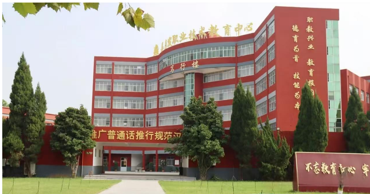
图 1 学校环境

蠡县启发职业技术教育中心始建于1991年，1993年开始招生，是教育部首批认定的“国家级重点中等职业学校”。学校占地345.1亩，建筑面积90400.67平方米，有教学楼、办公楼各1栋，学生宿舍楼4栋，多功能礼堂餐厅1座，综合楼1栋，13500平方米的运动场、篮球场，教学用微机室实验室设施齐全。开设幼儿保育、计算机应用、会计事务、电子商务、数字媒体技术应用五个专业。其中幼儿保育专业为省、市级骨干专业，计算机应用、电子商务专业为校级骨干专业。为县域经济发展做出了卓越贡献。学校先后被授予“河北省重点中等职业学校”、“河北省教学改革先进单位”、“保定市名校”等荣誉称号。