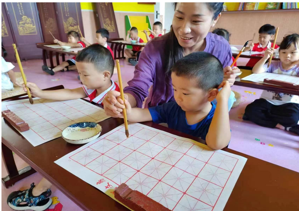
图 14 学校教师到小脚丫幼儿园实习

优化的专业结构，积极的产教融合，结合当地经济发展，提高专业建设水平，走专业化发展之路。加强教师培训，落实专业教师下沉到企业进行每年三个月实习培训。