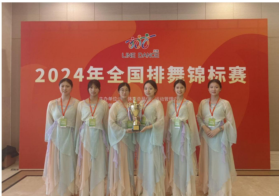
图 7 2024 年全国排舞锦标赛

2024 年保定市职业院校技能大赛中，学校学生在企业经营沙盘模拟赛项中荣获三等奖；在直播电商赛项中荣获三等奖。在 2024 年河北省职业院校技能大赛中，学生在网络建设与运维（中职）赛项中荣获三等奖；在婴幼儿保育项目中荣获三等奖；在数字产品检测与维护（师生同赛）项目中荣获二等奖；在职业礼仪赛项中荣获三等奖。在 2024 年全国排舞锦标赛中荣获一等奖。