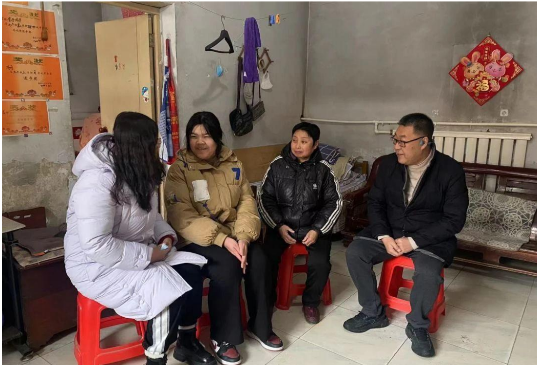
图 3 慰问家访