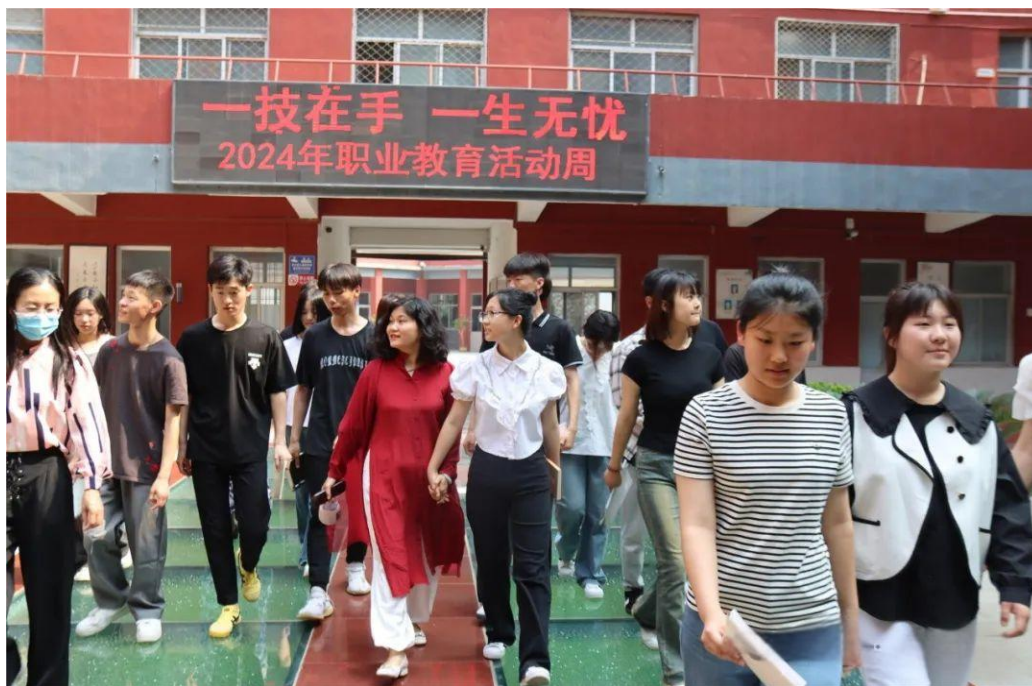
图 13 职业教育活动周家长开放日

5月22日上午，蠡县职教中心在实训楼三楼会议室举办2024年职业教育活动周启动仪式暨校园开放日活动，活动期间，学校全面开放校园，邀请学生家长、企业代表、社区居民等走进校园。在讲解员的带领下，来访学生、家长参观了学校环境、各专业实训室、餐厅、宿舍、操场，近距离感受学校深厚的人文底蕴和蓬勃向上的生命力。各位家长和同学深入了解了学校的校园环境、办学特色、师资力量、课程设置、学生活动等各方面的情况，感受到了学校的教育氛围和文化底蕴。