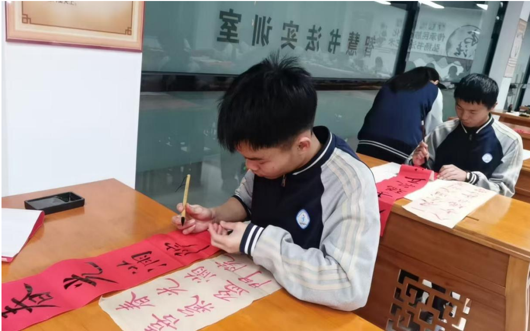
图 16 书法兴趣社团