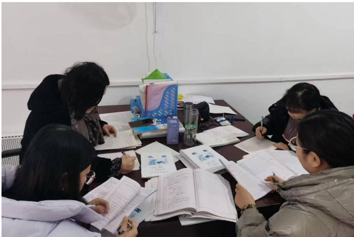
图 11 教师发展中心检查教案