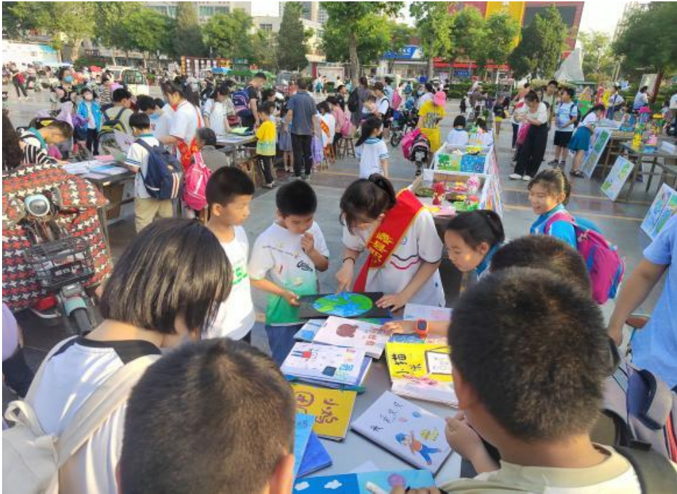
图 17 幼教学生在为小朋友介绍作品

2024年5月24日下午，蠡县职教中心在蠡县法治广场举办书画作品展，包括绘画作品、绘本、手工三部分内容。绚烂多彩的手工艺品，中职学生与教师的友好与热情，吸引了各级各类社会人士的驻足参观了解，得到了广大人民群众的热情关注。