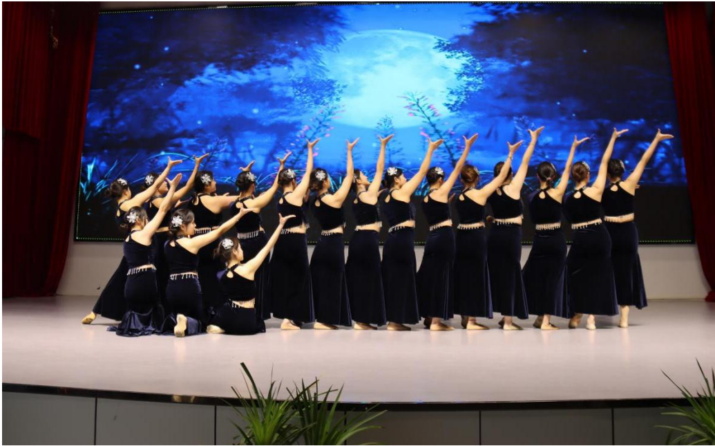
图 10 舞蹈特长生表演