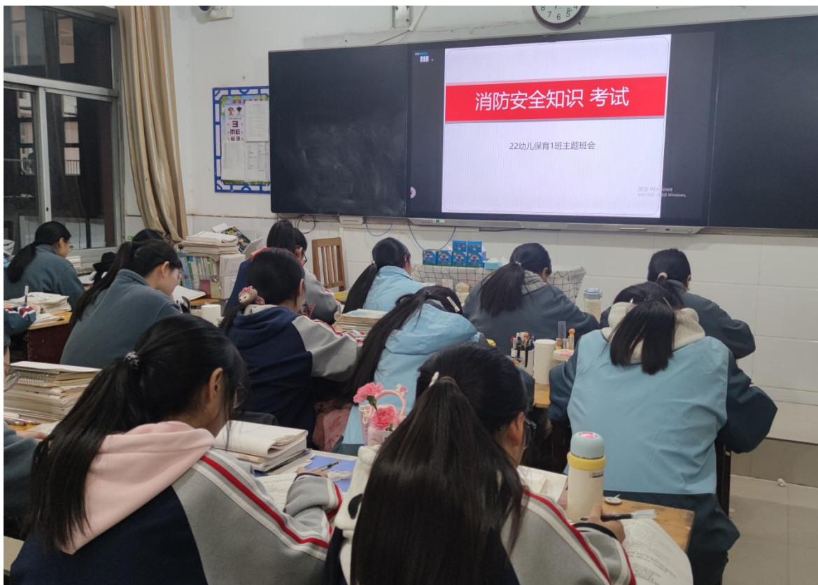
图 4 开展消防安全知识考试

在管理机制上，构建校、班两级管理网络，明确各级管理职责，确保工作组织有序、执行高效。严格落实文明行为规范，强化班级日常管理，建立一生一档。每日坚持晨午晚检，及时掌握学生健康状况。高度重视学生心理健康，心理教师定期授课，开展心理健康月等活动，如对 24 级全体学生进行心理测量，深入了解学生的心理健康状况，并根据测量结果开展有针对性的心理主题班会和讲座，帮助学生树立正确的人生观、价值观，培养积极向上的心态，增强心理调适能力，引导学生获得成长动力。