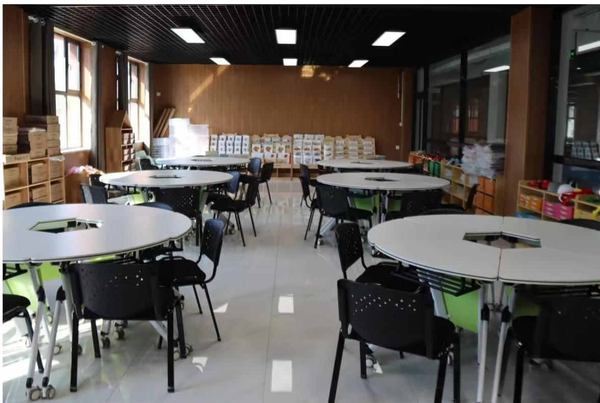
图 2 语言实训室

学校图书馆现有藏书 11.2 万册，图书分为政治、经济、文化、教育、社科、文学艺术、专业、综合等共 22 类，现有学生 3416 人，生均图书达到 33 册；订阅报刊 45 种；教师阅览室 1 个，建筑面积 176 平方米，座位 96 个；学生阅览室 2 个，建筑面积共计 556 平方米，座位 410 个。