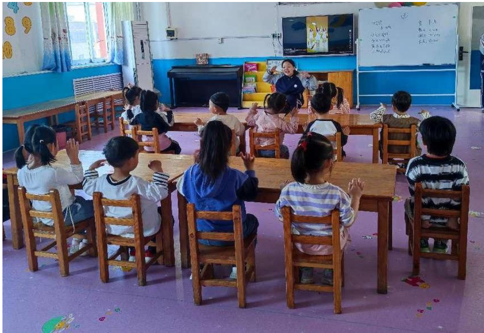
图 6 幼儿保育专业学生在小脚丫幼儿园实习